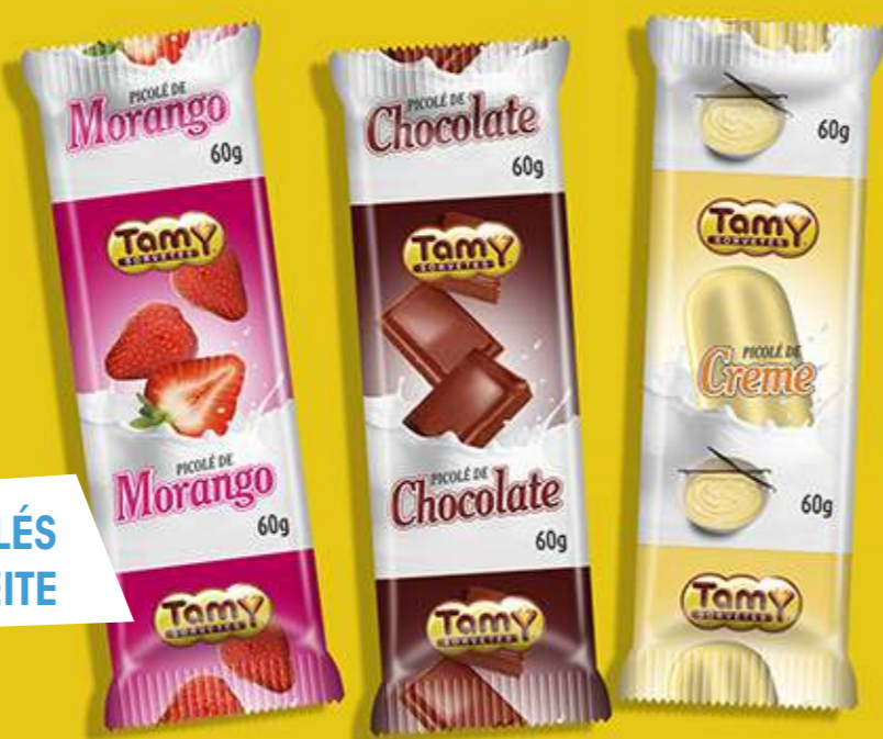
PICOLÉS AO LEITE