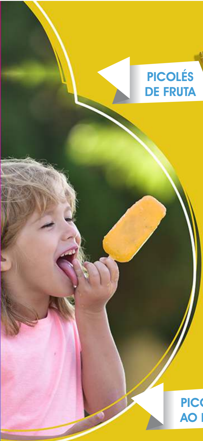
PICOLÉS DE FRUTA